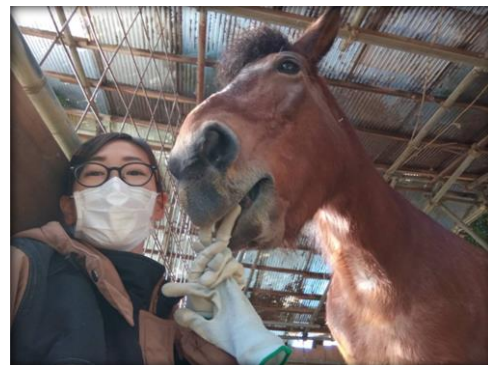
RDAJapan 賞受賞作品 「準備中の夢」